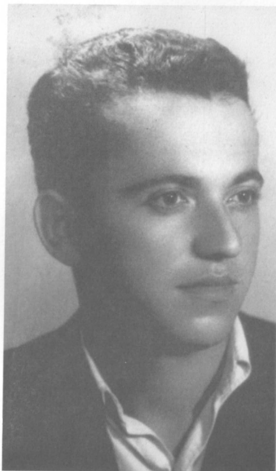
Автор, студент Белградского университета, перед арестом (1949)