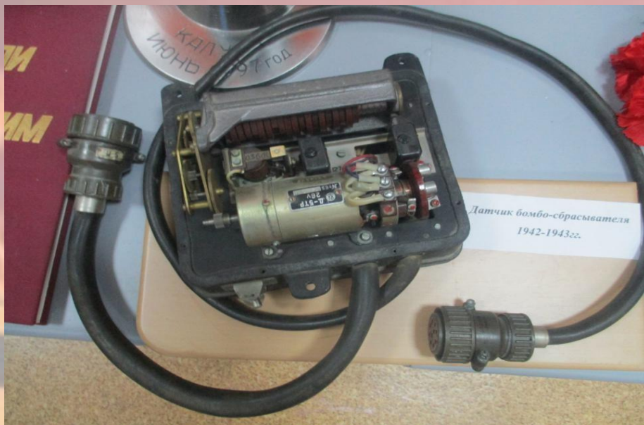
Датчик бомбосбрасывателя. 1942-1943 гг.