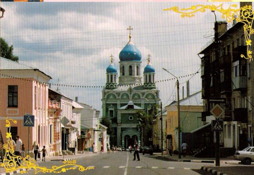
Город Елец. Улица Коммунаров. 2008 г.