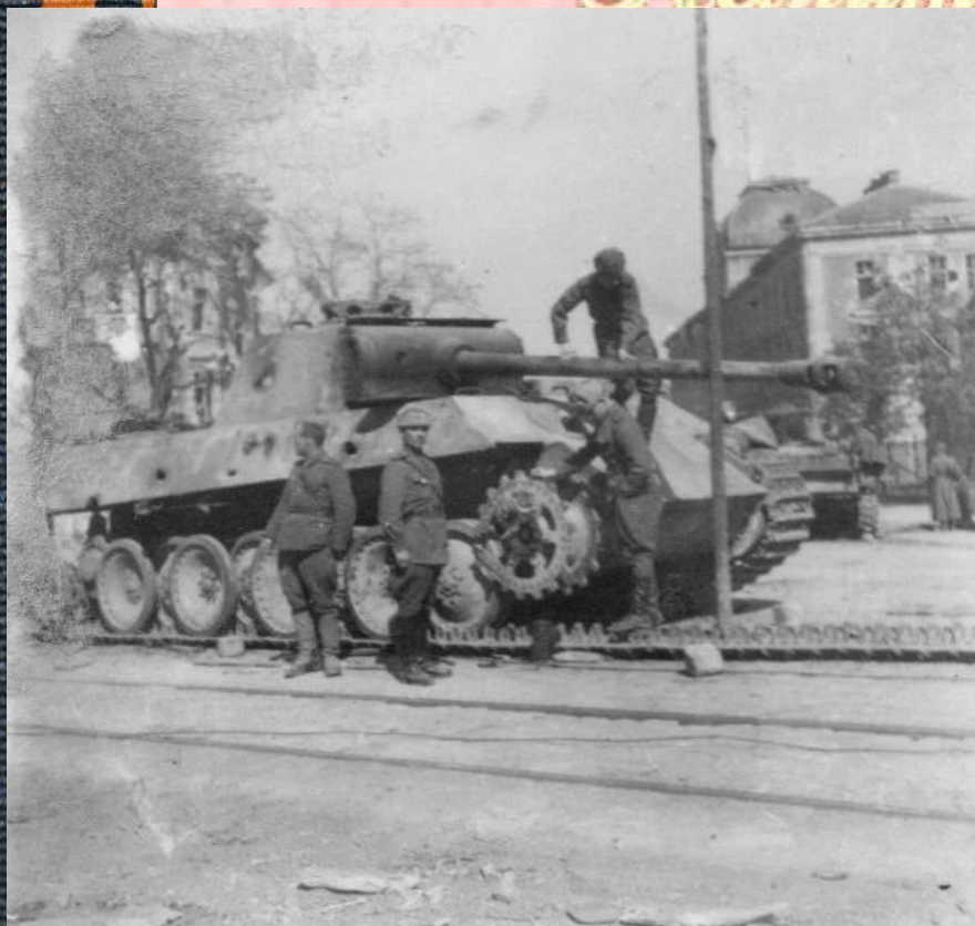
На улицах Вены. 13 апреля 1945 г. ( Фото у подбитого немецкого танка.