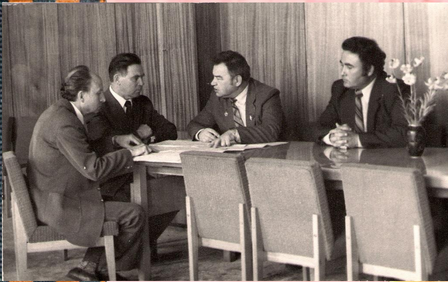
Рабочие будни. Встречи с представителем заказчика. Лётчик-космонавт СССР Гречко Г.М. 1983 г.