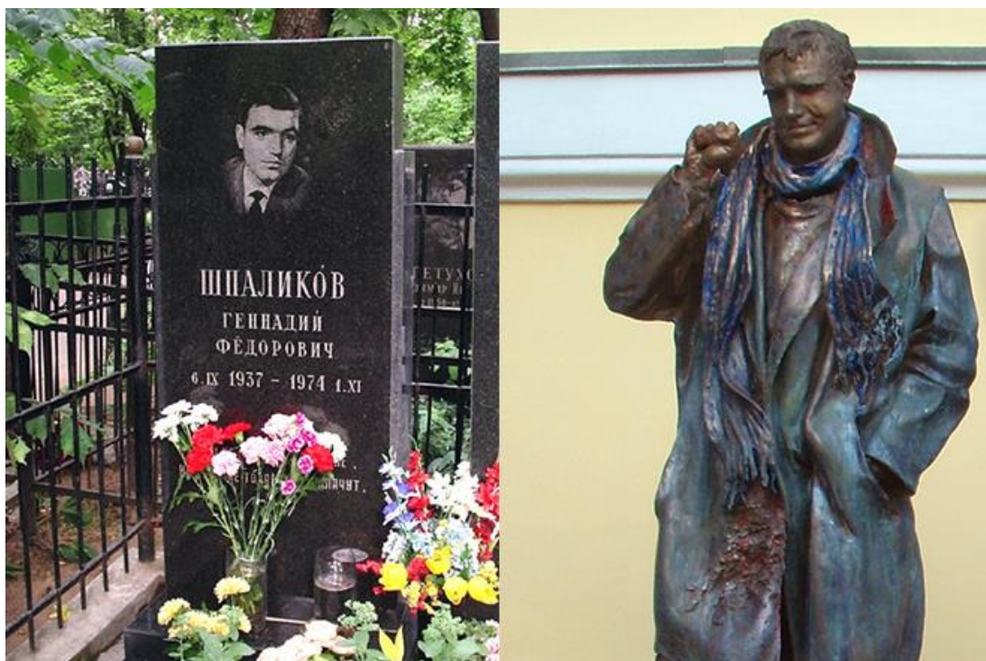
могила Геннадия Шпаликова и памятник возле ВГИКа.

Могила Г.Ф. Шпаликова находится на Ваганьковском кладбище. На памятнике высечены его строки: Страна не пожалеет обо мне, Но обо мне товарищи заплачут.