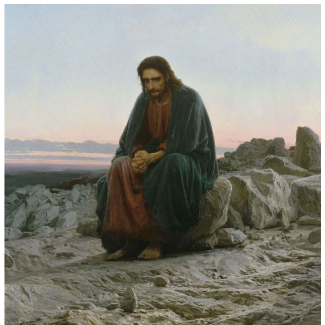
Крамской И.Н. Христос в пустыне

«Меланхолия» досталась художнику нелегко, расшифровывая аллегории античности и художественные символы Библии, им порой овладевало смятение: время шло, а замысел никак не ложился на бумагу: слишком многое хотелось сказать! В это время умирала его нежно любимая мать. Вглядитесь в «магический квадрат»: дата её смерти 15 мая 1514 года зашифрована в нём, как и год создания «Меланхолии». Мало того: как не считай, в сумме