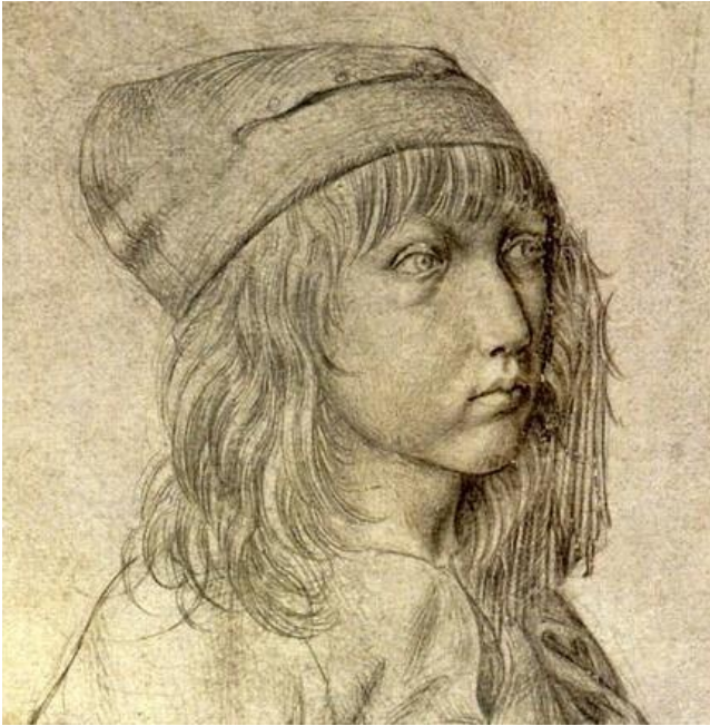
Автопортрет Дюрера, 13 лет

больными особо не церемонились: голод, избивание, держание на цепи, погружение в холодную воду, приложение пиявок, «прижоги на руках». Считалось, что сильная физическая боль отвлекает больных от боли душевной. Так лечили и английского короля Георга III, когда тот впал в депрессию, его жестоко избивали, во время «процедуры» король умер.