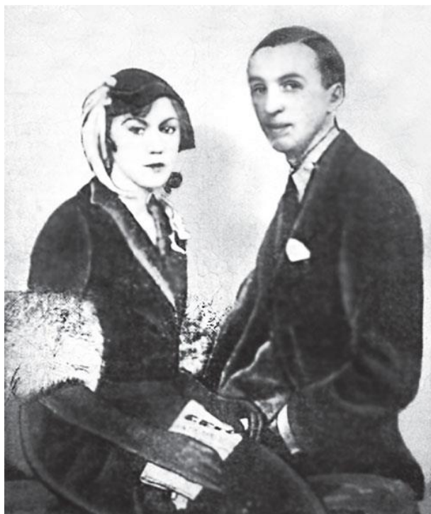
И.В.Одоевцева и Г.В.Иванов

Отечественной войны I степени. Для них, воспитанных на старых русских традициях, понятия «честь» и «Родина» - жизненное кредо.