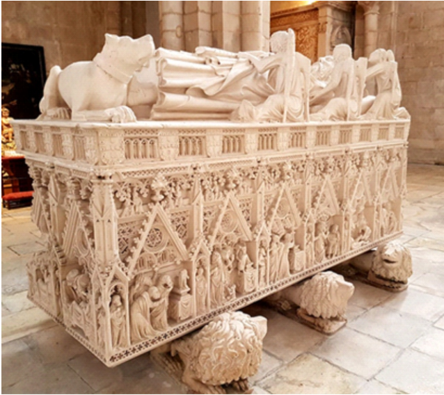
Саркофан Педру на шести львах и с псом, охраняющих покой

И тогда король задумал официальный обряд коронации тайной супруги. Всё для того, чтобы Инес могла быть похороненной в усыпальнице королей. Останки тела Инес де Кастро эксгумировали (через шесть лет после смерти), нарядили в подобающее одеяние и усадили на трон. Педру возложил корону на голову Инес, короновав ее посмертно. Придворных обязал присягать на верность новой королеве Португалии и целовать