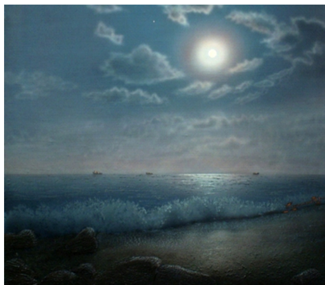
Лунная ночь на Днепре

А моя майская ночь совсем другая: чистая, хрустальная, прозрачная, как слеза, когда торжествуют белые, как размытый день, безлунные ночи. Да и ночами-то их не назовёшь, когда солнце катится за горизонт лишь за полночь. И не успеет природа окунуться в блаженную негу отдохновения, как пожар восхода пленяет сочными всполохами зари.