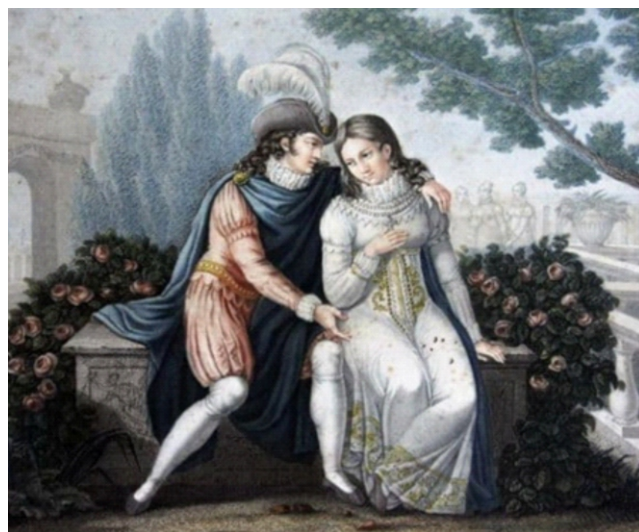
Легенда о любви короля Португалии Педру I и Инеш де Каштру