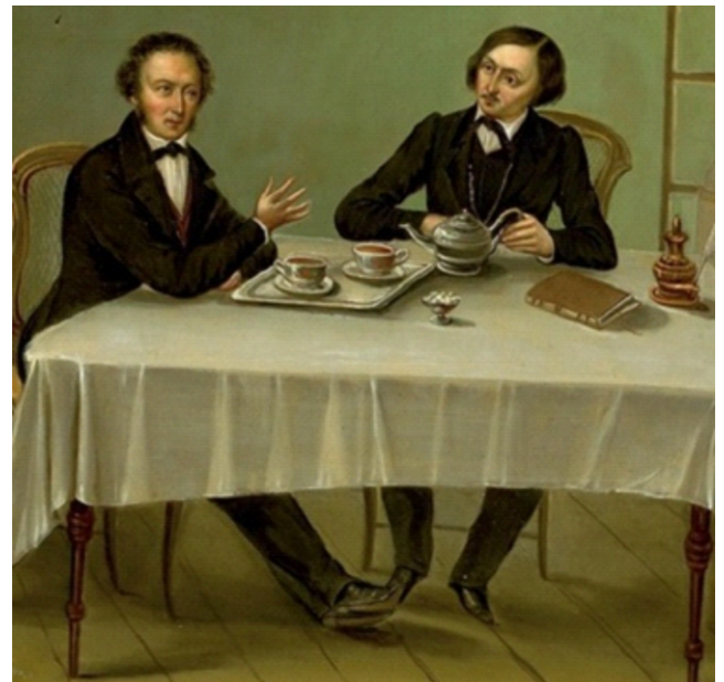
Пушкин и Гоголь. Худ. Н.М.Алексеев

– Книги с бессмертными произведениями самого автора, рукописи с рисунками на полях, зачитанная Библия и куча поношенных вещей. Вот и всё богатство. Единственной ценной вещью были золотые карманные часы, подаренные ему В.А. Жуковским в память об умершем Пушкине: