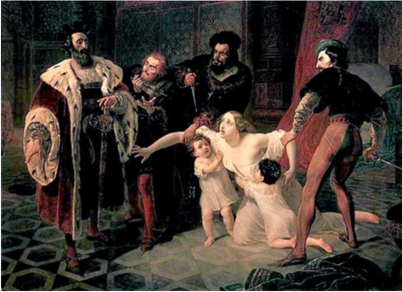
Карл Брюллов. Смерть Инессы де Кастро, 1834 г.

Как известно, «жениться по любви не может ни один король». При дворе началась борьба против Инес. Затянувшийся роман стал настолько серьёзным, что мог испортить внутривосточные и международные отношения, навредить королевскому трону. Возникли осложнения с родителями невестки, а также дружба Педру с братьями Инес не приветствовалась при дворе короля, поскольку тех подозревали в подготовке заговора. А вдруг и в самом деле девушку использовали в закулисных играх престолов? Против воли возлюбленного её отправили в замок Албукерке.