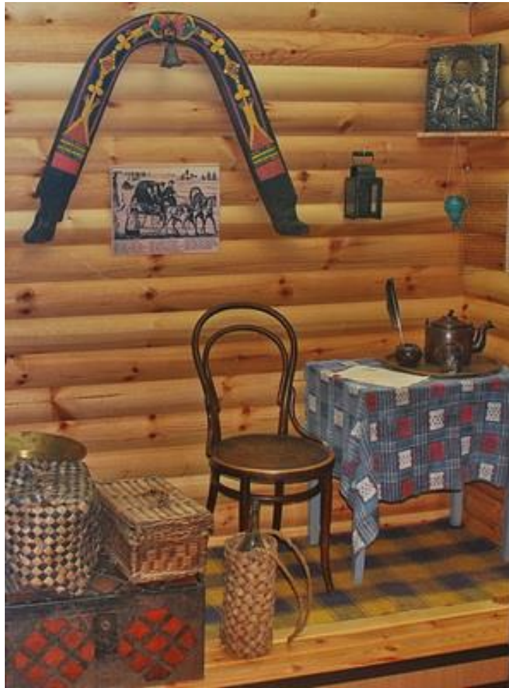
Кунгурский краеведческий музей