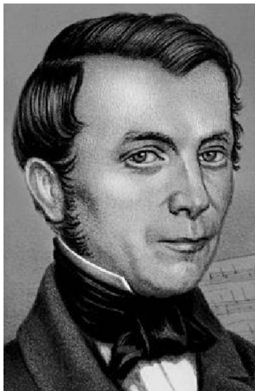
Александр Львович Гурилёв

Тяжелая работа подорвала силы композитора, жил он бедно, психическая болезнь приковала его на десять лет к больничной койке. О кончине А.Л. Гурилёва 30 августа (11 сентября) 1858 года узнали не сразу, пока однажды о печальном известии не оповестил газетный некролог.