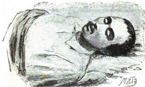
Посмертный рисунок. Художник Швед.

Выстрел Мартынова потряс небеса, небесная твердь дрогнула и разверзлась, началась невиданной силы гроза, ударил гром, ошалевшие молнии судорожно бились в грозном небе, и дождь, безмерно опечаленный, долгий и тяжёлый, потоком горьких слёз оплакивал невосполнимую потерю.