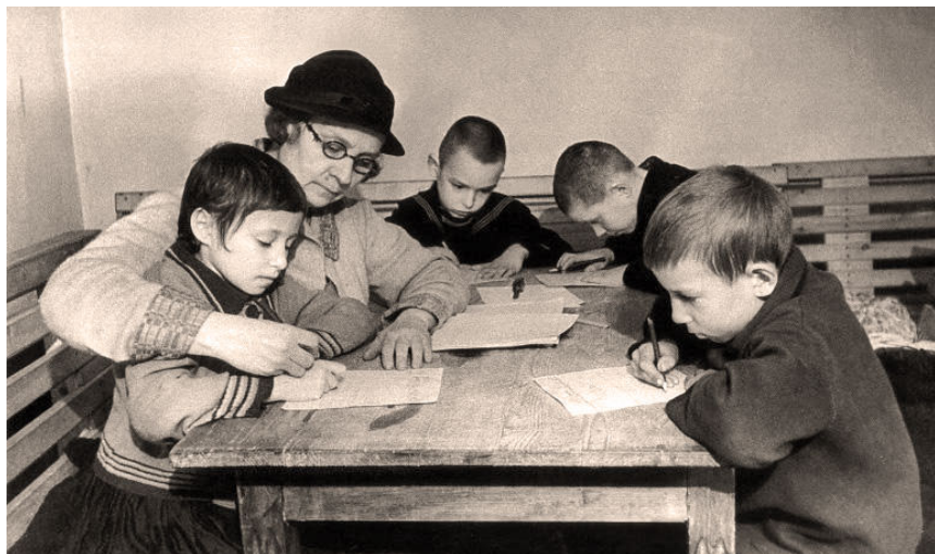
Школьный урок в блокадном Ленинграде