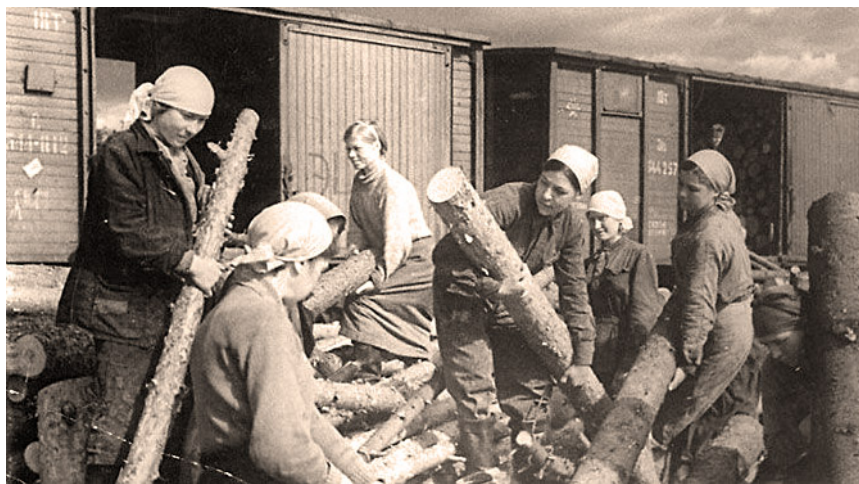
Женщины на разгрузке леса