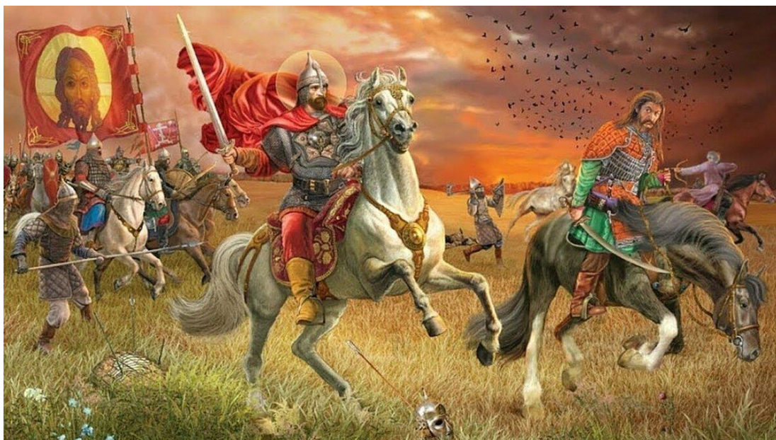
Дмитрий Донской. Куликовская битва

...Поднялась Земля супротив беды, супротив врага-погубителя. Вперекор врагу поднялся народ, Грянул смертный бой нескончаемый! Даже мертвые оживали вновь, выходили они из сырых могил, чтоб живым помочь в битве яростной, чтобы вновь принять смерть за Родину! А кто слабым был - сильным стал тогда. А кто сильным был - стал еще сильнее.