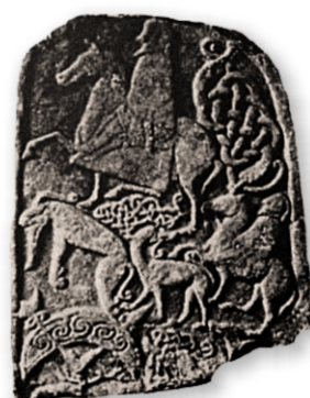
Северный бог, небесные звери и конунг. Середина 7 тыс н.э.

который занимался историей Руси. А как восторгался Берендеевой землёй композитор Н.А. Римский-Корсаков, когда писал музыку к опере «Снегурочка»! Русский живописец В.М. Васнецов с большим вдохновением рисовал эскизы костюмов и декорации к «Снегурочке». В русских народных сказках Снегурочку, вылепленную из снега, представляли как символ замёрзшей воды, которая тает под лучами солнца. Не остался в стороне и поэт В.А. Жуковский, – учитель юных императоров, придумал сказку про царя Берендея, его сына Ивана царевича и Марью – царевну. Да и А.С. Пушкин не раз упоминал Берендеево царство.