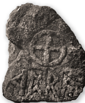
Готский рунный камень. Таврида. Середина 7 тыс н.э.

Самобытный народ и скрытые глухими лесами земли будили воображение творческих людей, привлекали их в мало изведанные края. Так, молодой поэт А.Н. Островский посетил Переславль и Костромскую землю и описал сей край: «Меря-земля, обильная горами и водами, и народ рослый, и красивый, умный и откровенный, обязательный и вольный ум, и душа нараспашку. Тип русской красоты, солидной, которая меряется саженью и особенным каким-то широким вкусом». А о женщинах поэт отзывается восхитительно: «Красавицы в русском вкусе, учтивость русская, обворожительная, с улыбкой; без заграничного лоску, а так в душу лезет. Что за типы, что за красавицы женщины!». Это и побудило поэта написать волшебную сказку «Снегурочка». Этнографическую сторону он почерпнул у знаменитого А.Н. Афанасьева,