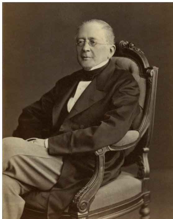
Александр Михайлович Горчаков

Грандиозные преобразования, начатые Александром II, требовали спокойствия на границах. И это спокойствие удалось обеспечить мудрой дипломатией и терпением народным. Министр иностранных дел Александр Михайлович Горчаков осторожно, шаг за шагом восстанавливал позиции России в Европе, избегая резкого обострения ситуации. Глава российского МИДа начал всё сначала. Александр Михайлович обеспечил