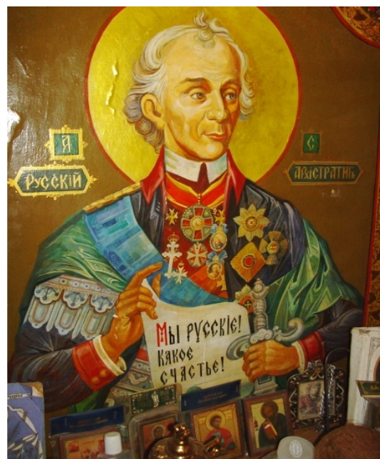
Св. благоверный Л. В. Суворов

Верой своей Россия сильна. Главное в любой сфере жизни народа – экономической, социальной, политической, – это духовное состояние его. Печальный опыт показал, что иллюзорные мечты о свалившемся ниоткуда богатстве, погоня за ложными ценностями ни к чему хорошему не привели. Теперь перестали мечтать о несбыточном, а начали просто трудиться. Сказано: многими трудами и скорбями надлежит войти в Царство Божие. – (Деян. 14:22).