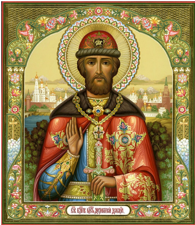
Св. благоверный Дмитрий Донской

тишину во внешней политике, не вмешивался, куда не следует. В результате дипломатических манёвров Россия выиграла время для внутренних преобразований. В партнёры Горчаков выбрал влиятельного политика – главу правительства Пруссии Отто фон Бисмарка. Горчаков и Бисмарк зачастую поддерживали друг друга, соблюдая нейтралитет в некоторых взаимовыгодных вопросах. Поэтому единого европейского фронта против России выстроить не удалось. Горчакова упрекали, что Россия устранилась и молчит. На что тот ответил: «Говорят, что Россия сердится. Россия не сердится, Россия сосредотачивается». В 1870 году, когда международная ситуация изменилась, Франция проиграла в войне с Пруссией, а позиции Австрии ослабли, тогда А.М. Горчаков принёс европейским державам пренеприятное известие: Россия в одностороннем порядке снимает с себя все ограничения на право иметь военный флот на Черном море. Европа негодовала, Великобритания была в ярости, но составить антирусскую коалицию не сумела. В результате была одержана важная победа – Россия вернула право на Черноморский флот. В 1877 году русская армия вступила в войну с Турцией и одержала ряд блестящих побед, на этот раз помешать ей никто не смог. В Чёрном море появился обновлённый торговый и военный флот. Так Россия укрепила свои позиции в мире, её авторитет был восстановлен. Надолго ли? Почти на сорок лет.