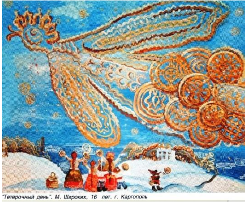
"Тетерочный день". М. Широких, 16 лет. г. Каргополь